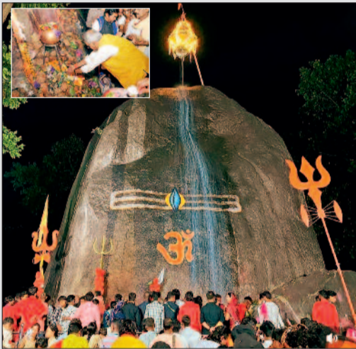
जाम की स्थिति, प्रशासन सतर्क