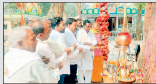
प्रदेशभर से पहुंचे श्रद्धालु

गरियाबंद गौरव पथ मार्ग से लेकर मंदिर स्थल तक श्रद्धालुओं की भीड़ के कारण दिक्कत जाम की स्थिति बनी रही। हालांकि प्रशासन और पुलिस बल द्वारा भीड़ नियंत्रण, पार्किंग, पेयजल और सुरक्षा के व्यापक इंतजाम किए गए थे, फिर भी आस्था के आगे व्यवस्थाएं छोटी पड़ती नजर आईं। शांति व्यवस्था बनाए रखने के लिए पुलिस बल तैनात रहा।